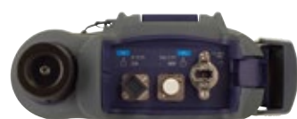
Разъемы четырехволнового OLTS-85P