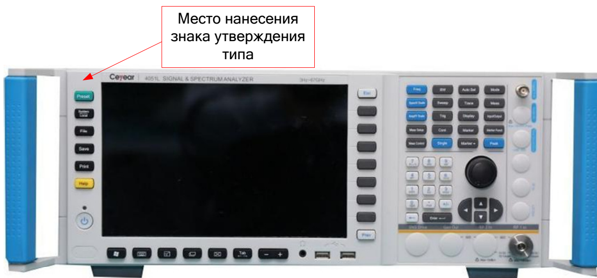
а) Вид спереди