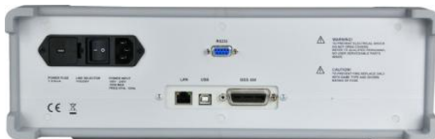
Рисунок 2 – Фотография задней панели магазинов М525