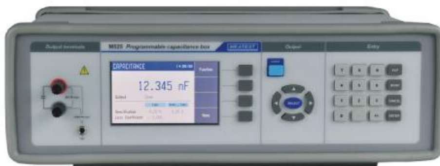
Рисунок 1 – Фотография передней панели магазинов М525

Фотографии общего вида магазинов представлены на рисунках 1, 2, 3, 4.