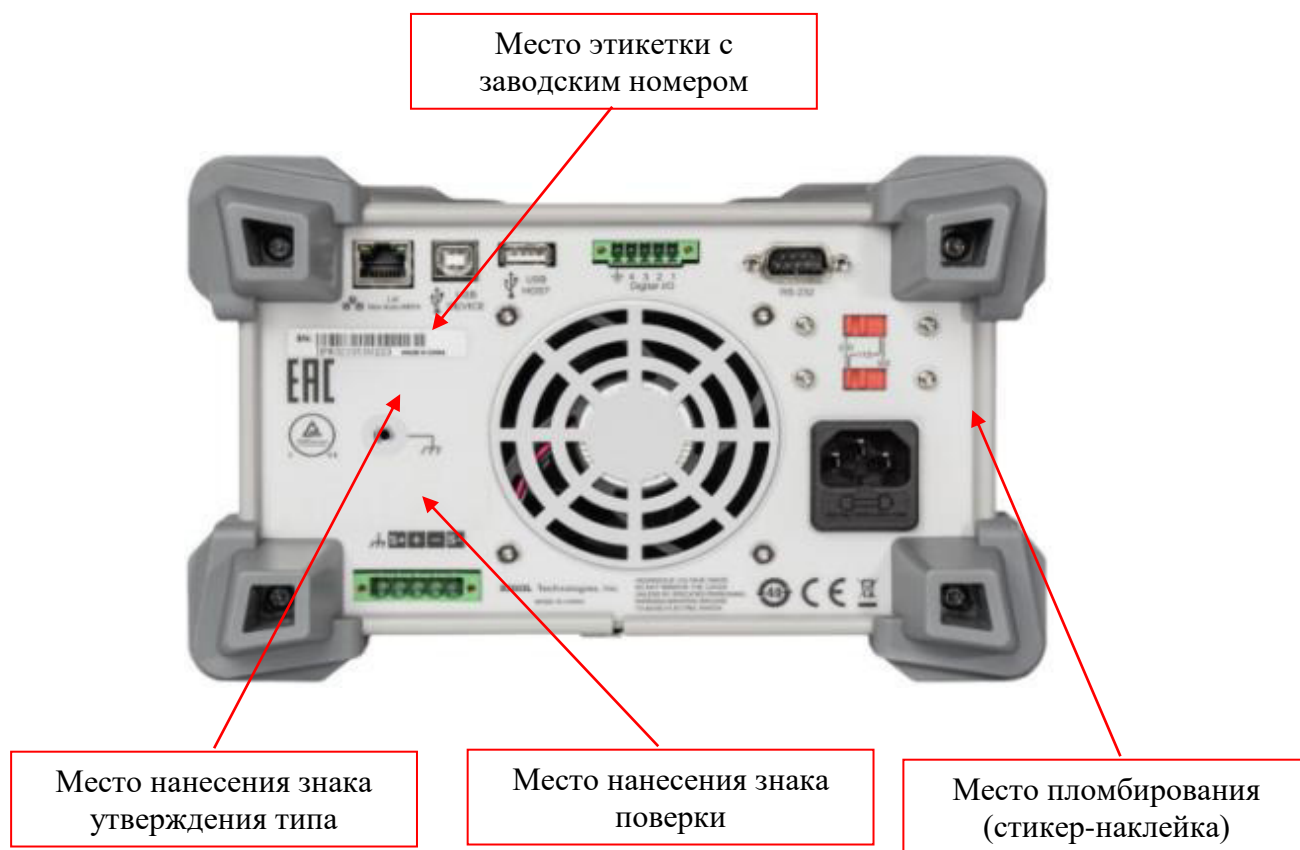
Рисунок 2 - Задняя панель источников модификаций DP811/DP811A, DP813/DP813A