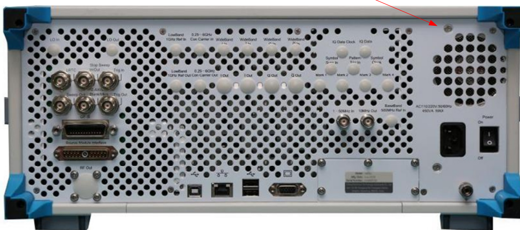
б) Вид сзади