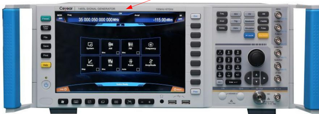
а) Вид спереди